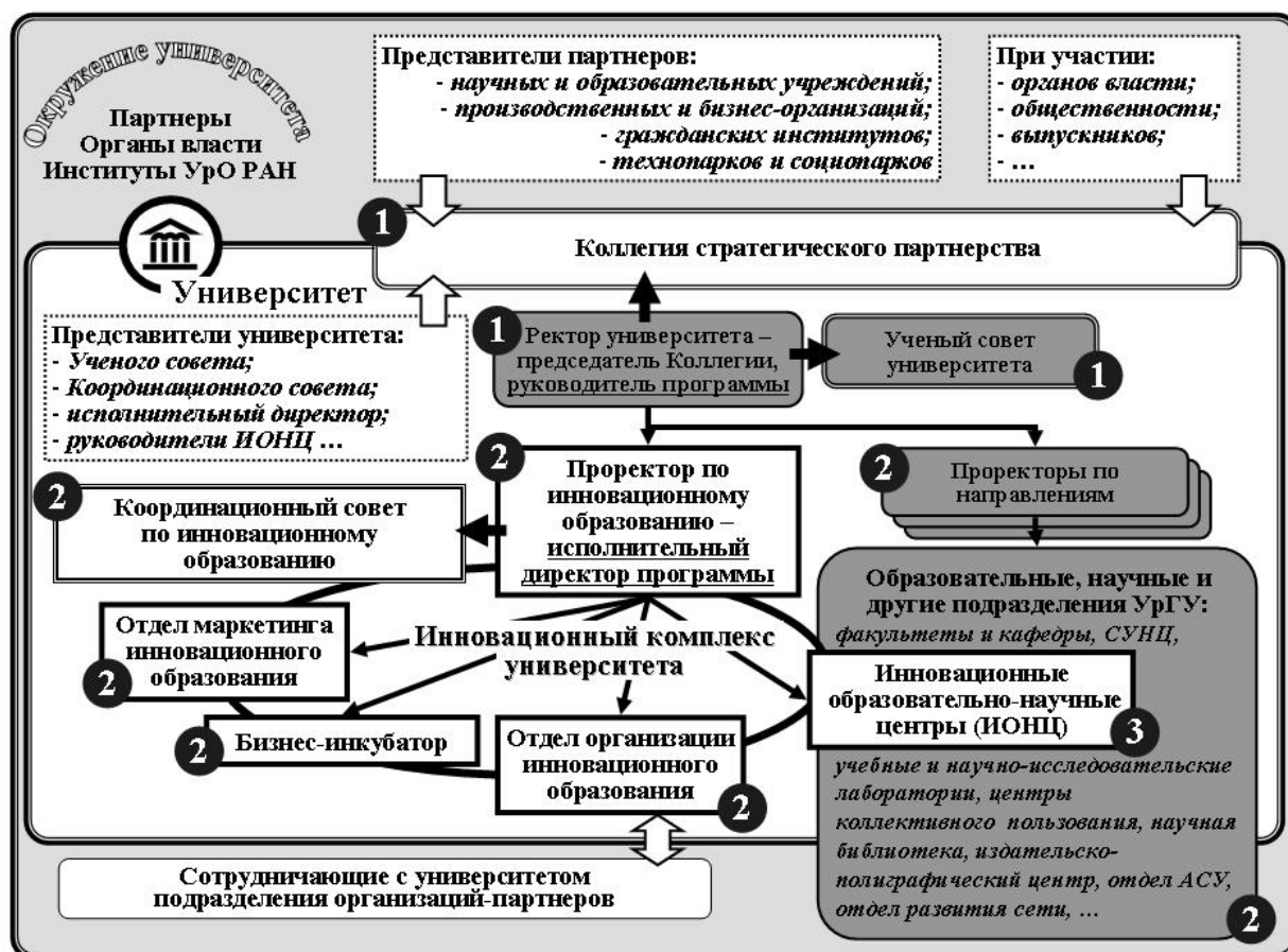
Рис. 1. Общая схема управления инновационной образовательной программой (1, 2, 3 — номера уровней)

Сравнительные параметры НОЦ и ИОНЦ представлены в таблице.