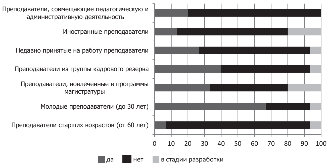
Рис. 2. Наличие в вузе специальных программ для различных групп ППС, %