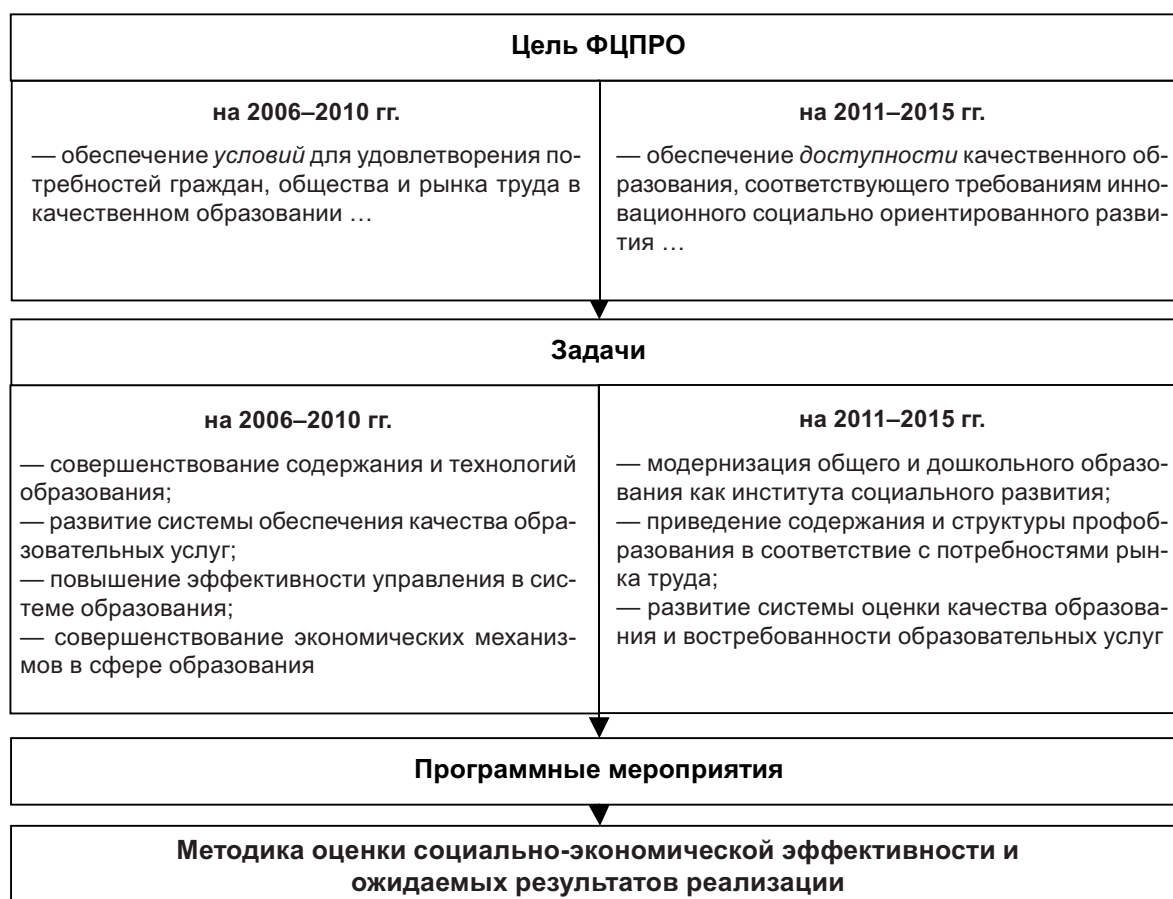
Рис. 1. Механизм реализации федеральных целевых программ развития образования

Сравнительное аналитическое исследование индикаторов и показателей ФЦПРО выявило: