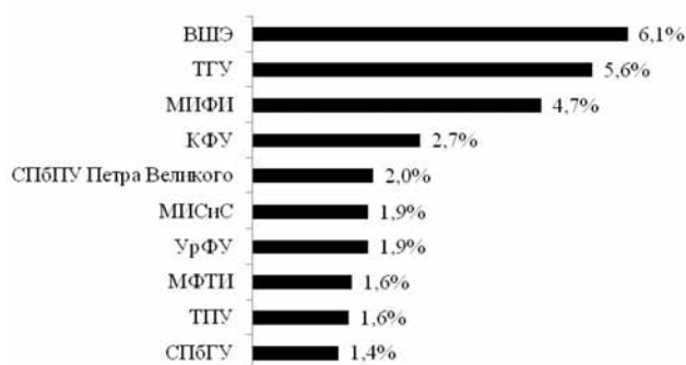
Рис. 3. Топ-10 российских вузов по удельному весу численности иностранных граждан из числа научно-педагогических работников (НПР) в общей численности НПР [9]

Согласно данным мониторинга деятельности образовательных организаций высшего образования 2016 г., среди российских вузов по количеству иностранных преподавателей лидируют НИУ «Высшая школа экономики» (6,1 %), Томский государственный университет (5,6 %), Национальный исследовательский ядерный университет «МИФИ» (4,7 %) (рис. 3) [9].