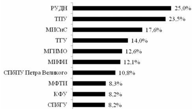
Рис. 2. Топ-10 российских вузов по удельному весу численности иностранных студентов в общей численности обучающихся [9]

Российские вузы, как правило, привлекают преподавателей из-за рубежа, уже имеющих опыт работы в ведущих мировых университетах. Их знания и навыки должны способствовать развитию конкурентных преимуществ вуза, к которым относятся [10]: