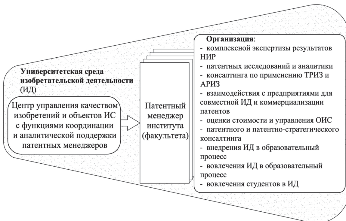
Рис. 5. Организационный механизм управления качеством изобретений