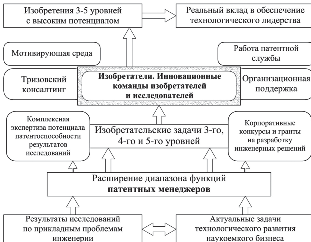
Рис. 4. Модель организации университетской ИД для повышения качества ее результатов и вклада в технологическое развитие страны

Несмотря на осознание важности ИД, в вузах доминирует ориентация на исследовательскую работу. Например, в УрФУ (одном из лидеров по количеству заявок на патенты среди российских вузов) при планировании результатов исследований в 2023 году по технологическим проектам в рамках программы «Приоритет 2030» количество запланированных заявок на изобретение составляло около 2 % от количества запланированных научных публикаций [29]. В настоящее время объем результатов прикладных исследований на порядок превосходит количество изобретений, но не потому, что в них мало патентоспособных идей и решений, а потому, что не осуществлялся их поиск. Это происходит из-за того, что большинство авторов не занимаются изобретательской деятельностью, в том числе по причине отсутствия знаний