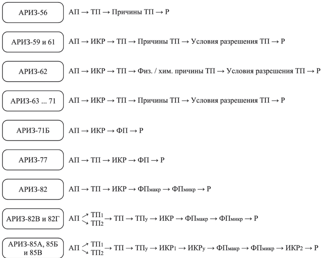
Рис. 1. Эволюция логики алгоритма решения изобретательских задач (АРИЗ)* Fig. 1. Evolution of the logic of the algorithm for solving inventive problems (ARIZ)

* АП — административное противоречие; ТП — техническое противоречие; ТПУ — техническое противоречие усиленное (предельное состояние); ИКР — идеальный конечный результат; ИКР 1 — идеальный конечный результат (усиленная формулировка); ФП — физическое противоречие; ФП макр — физическое противоречие на макроуровне; ФП микр — физическое противоречие на микроуровне; Р — решение