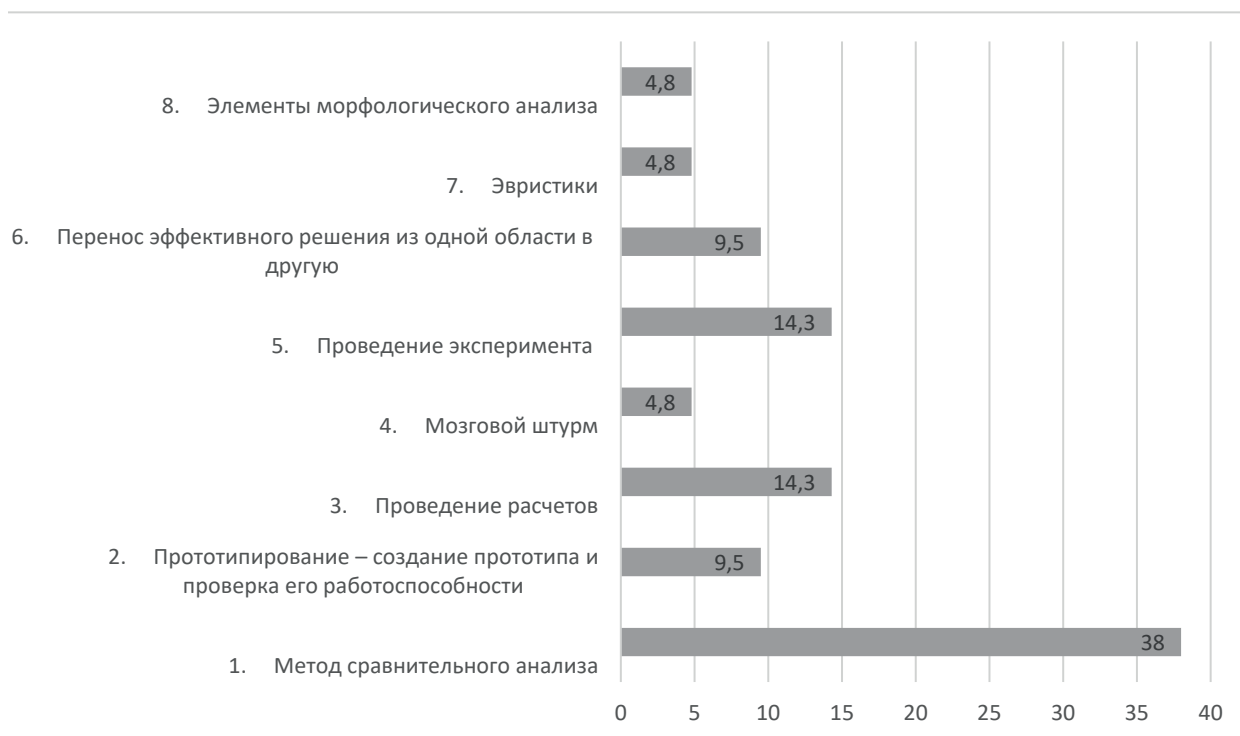
Рис. 3. Методы, используемые для разработки изобретений университетскими специалистами, и частота их применения

Пятый и шестой этапы АРИЗ-85В применяются в случаях, когда задача не получила приемлемого решения на четвертом этапе, где предусмотрено: применение информационного фонда – обширной